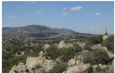
Vistas desde Cuevas del Mar y Canto del Búho, respectivamente. En ambas puede verse La Tortuga