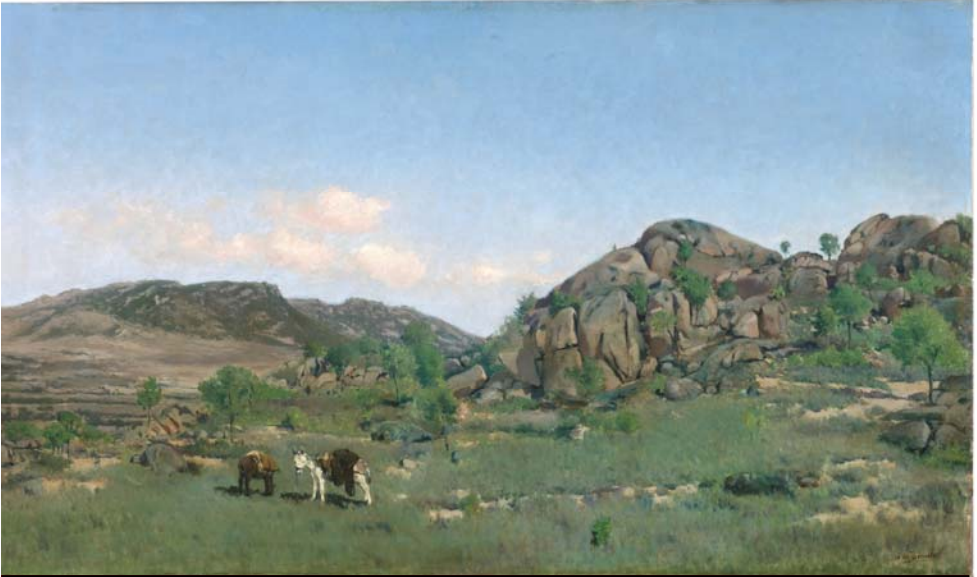
“Paisaje de Torrelodones”. Aureliano de Beruete, 1891

mente que todavía permanece, con mucha más vegetación y con el núcleo hoyense de La Berzosa, el mismo escenario que Beruete inmortalizó.