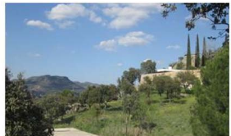
A la izquierda 'Paisaje de Torreldones' y a la derecha el mismo lugar fotografiado 128 años después.