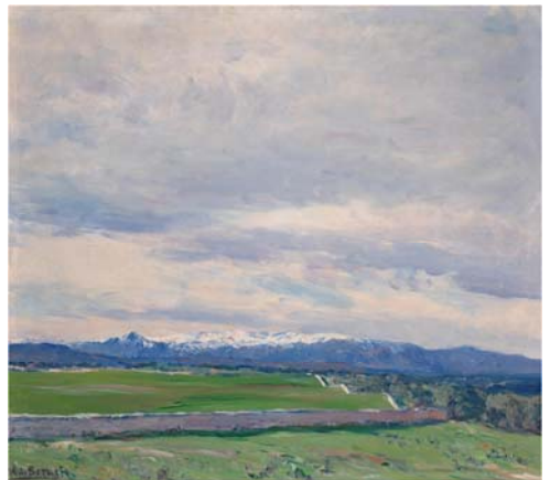
“La tapia del Pardo”. Aureliano de Beruete 1911