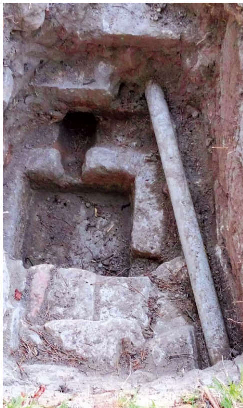
Trabajos de limpieza y descubrimiento del sistema hidráulico del Juncarejo

cial o maquinaria del Parque Regional de la Cuenca Alta del Manzanares.